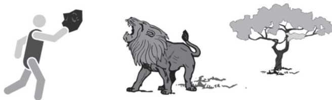
圖表 1. 圖畫(準)文字所描寫 ê 語音單位是 kui-ê 故事 ê 內容。

食。因爲 chit pak 圖描寫 ê 是 kui-ê 故事，有 seng chē 資訊無具體描寫出來，到底伊 beh 表示啥物意思，kan-ta n 畫 chit pak 圖 ê 人 ka-tī 知影。Tng-tong 其他 ê 族人看著 chit pak 圖 ê 時，in 就 ài tī hia“說文解字”、ioh 看作者 ê 意思是啥。Tī chit 種情形之下，100 個人來看，可能有 101 種 ê bô-kāng 解釋。